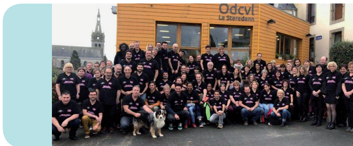
Personnel Odcvl lors de l'Assemblée Générale de 2019