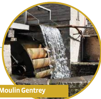
au Moulin Gentrey

Riches de leurs expériences et de leurs formations ils apportent leurs connaissances et leurs savoirs-faire de manière interactive et ludique.