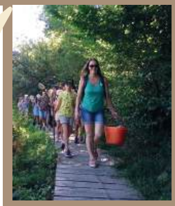
sentier découverte nature