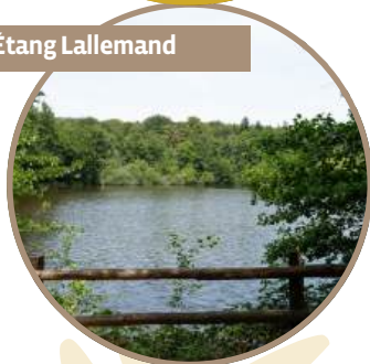
à l'Étang Lallemand