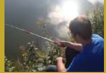
Ces Poissons qui ont la pêche!