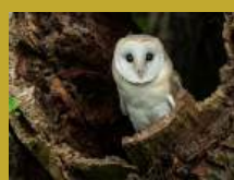
Les hiboux c'est chouette!